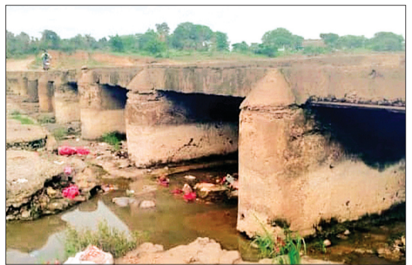
आष्टा। निपानिया-मैना मार्ग पर स्थित पार्वती नदी का बरसों पुराना है पुल।