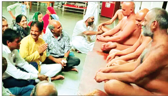
आचार्य श्री विद्यासागर महाराज के शिष्य मुनि निष्पक्ष सागर महाराज ने संसंध चातुर्मास के लिए आष्टा आने की सहमति दी है। इसकी खबर मिलते ही नगर के समाजजनों ने खुशी जाहिर की है। समाज के पूर्व

जैन समाज के चातुर्मास प्रारम्भ होने को कुछ ही दिन शेष है। ऐसे में दिगंबर जैन मुनि और आर्यिका संघ के चातुर्मास स्थान पर पहुंचने के लिए सभी के निरन्तर विहार चल रहे हैं। आष्टा में दो माह से दिगंबर जैन समाज के सैकड़ों श्रावक-श्राविकाएं कुंडलपुरा पहुंच कर आष्टा चातुर्मास करने के लिए आचार्य श्री के चरणों में निवेदन कर रहे थे। इसके बाद समाजजनों की विनती को स्वीकार करते हुए